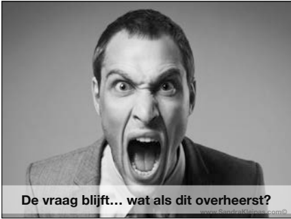
De vraag blijft... wat als dit overheerst?