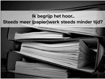
Ik begrijp het hoor.. Steeds meer (papier)werk steeds minder tijd?