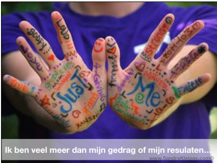
Ik ben veel meer dan mijn gedrag of mijn resultaten...